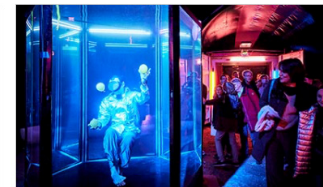
LES FAUVES 06/11/2024 au 09/11/2024