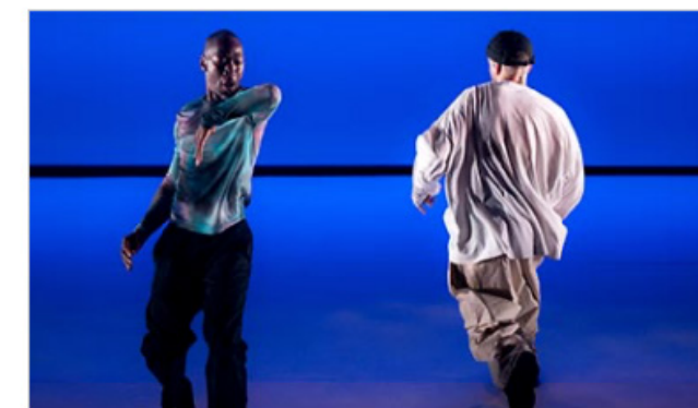
LOVE YOU, DRINK WATER 05/10/2024